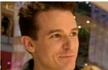
Volker Siegel Datenbank und Internetseite www.free-berlin.info